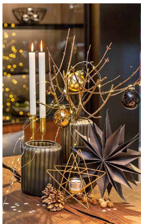
Einige Zweige, Zapfen und etwas Grün nehmen den Kerzenhaltern und den dunkelgrauen Vasen ihre Geradlinigkeit.

auf dem Tisch schmücken. Naturmaterialien wie Eukalyptus- und Tannenzweige, Kiefernzapfen oder auch die wieder angesagte Amaryllis lockern der Expertin zufolge das Ensemble auf dem Tisch auf, das dank der geraden Linien und der schlichten Designs andernfalls fast zu