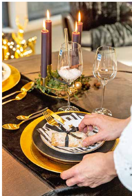
Als Willkommensgruß gibt es einen kleinen Stollen – natürlich mit farblich passendem Band verschnürt.