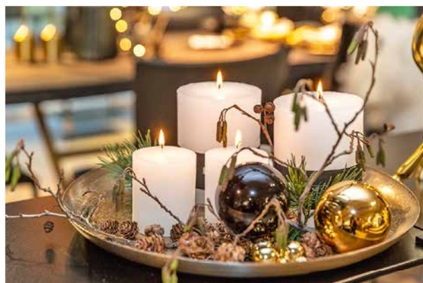
Etwas Neues, etwas Gefundenes, etwas Schwarzes: Der Adventskranz vereint gleich mehrere Trends.